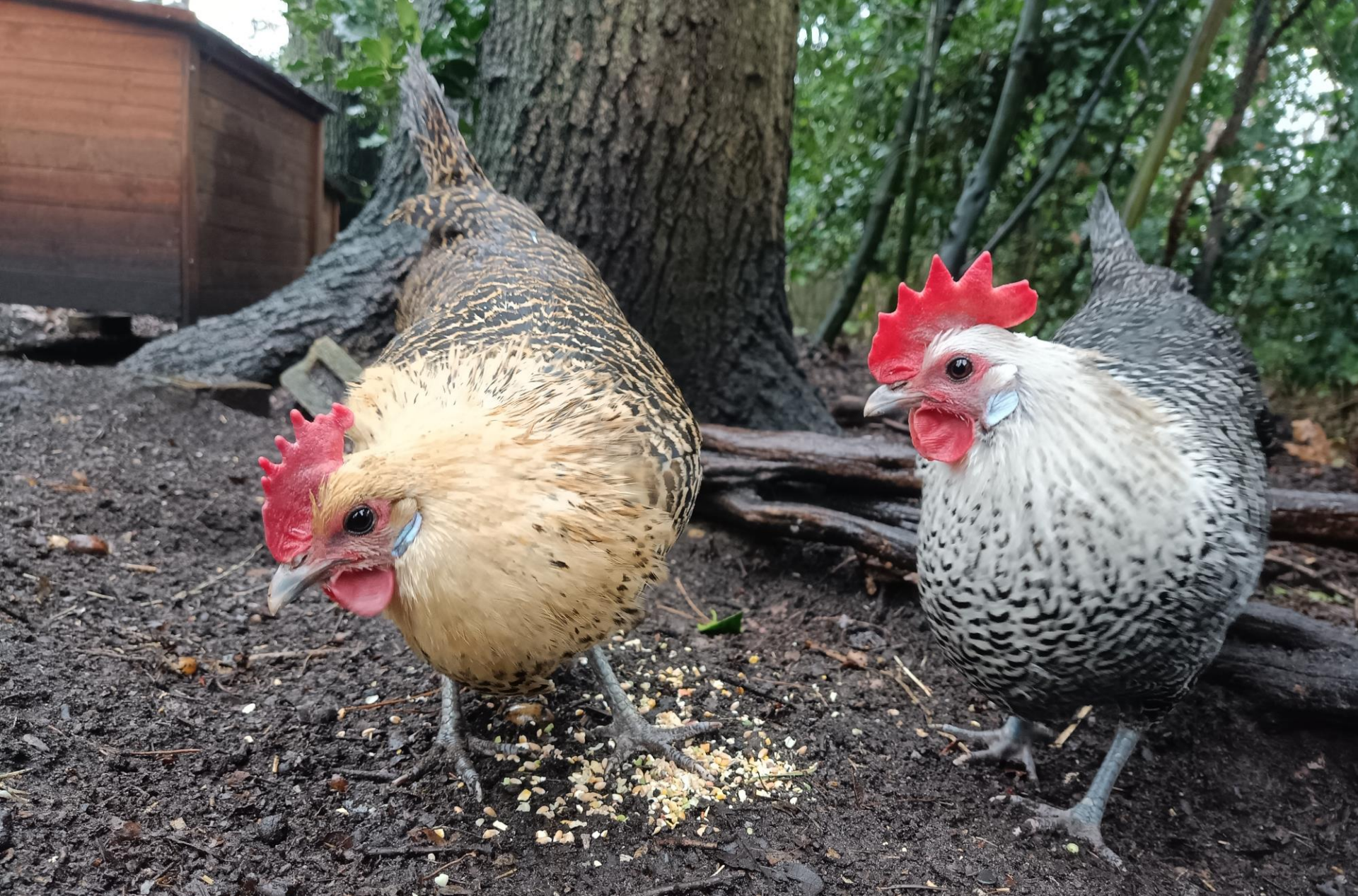
(KWEKEN VAN) HET KEMPISCH HOEN